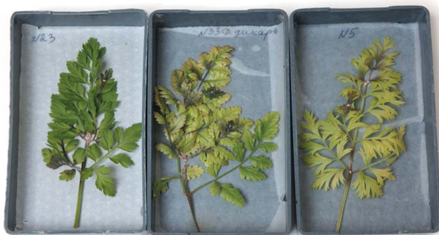
Рис. 4. Заражение листьев моркови T. roseum L. в лабораторных условиях

3. Среди культур семейства Сельдерейные наблюдается дифференциация по восприимчивости к данному возбудителю.