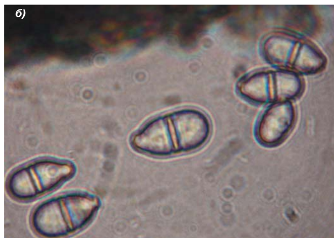
Рис.3. а) Конидиеносцы и ложная головка конидий T. roseum ; б) конидии грушевидной формы с перетяжкой.