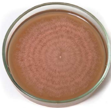
Рис.2. Чистая культура T. roseum на агаризованной среде.

оценке сортообразцов по типам устойчивости. Для этого на отделенных листьях укропа, петрушки корневого и листового, сельдерея, пастернака, моркови, любистока проводили инокуляцию чистой культурой гриба с последующей инкубацией во влажной камере (рис.4).