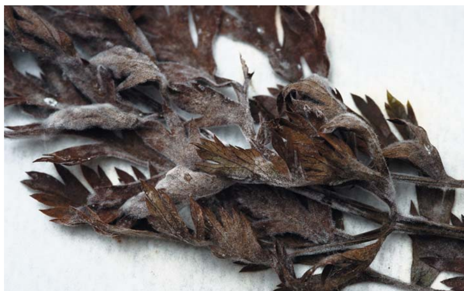
Рис. 1. Развитие T. roseum на листьях моркови во влажной камере.

Заражение вегетирующих листьев моркови возбудителем T. roseum ,